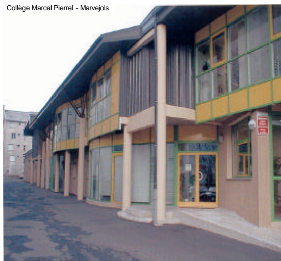
Collège Marcel Pierrrel - Marvejols